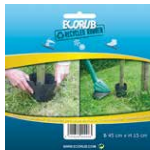
Protection des pieds des arbres