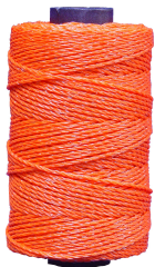
BOBINA 3 HILOS 5410-A