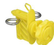
AISLADOR UNIVERSAL PUERTA 5420-F