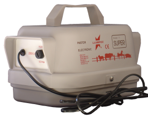
A RED 5400-B / E / F / G