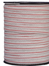
CINTA 5 HILOS 5410-C