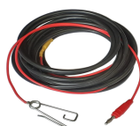
CABLE 5450-CAB5 CAB10 / CAB25