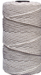
BOBINA 9 HILOS 5410-E