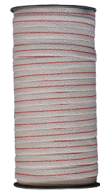
CINTA 7 HILOS 5410-D