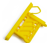
AISLADOR UNIVERSAL 5420-E