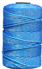
BOBINA 6 HILOS 5410-B