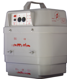
CON BATERÍA 5400-C