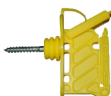
AISLADOR MADERA 5420-C