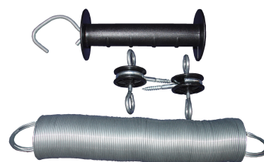
KIT COMPLETO PARA PUERTA 5440-A