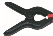
8003-A / B