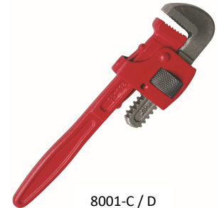
8001-C / D