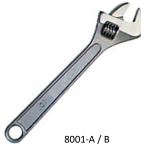
8001-A / B