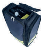
Bolsillo 1er acceso