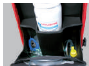
Total acceso al material