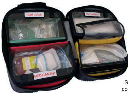
Acceso directo al contenido por abertura total

Se suministra con 4 maletines extraíbles 28 x 16,5 x 8 cm