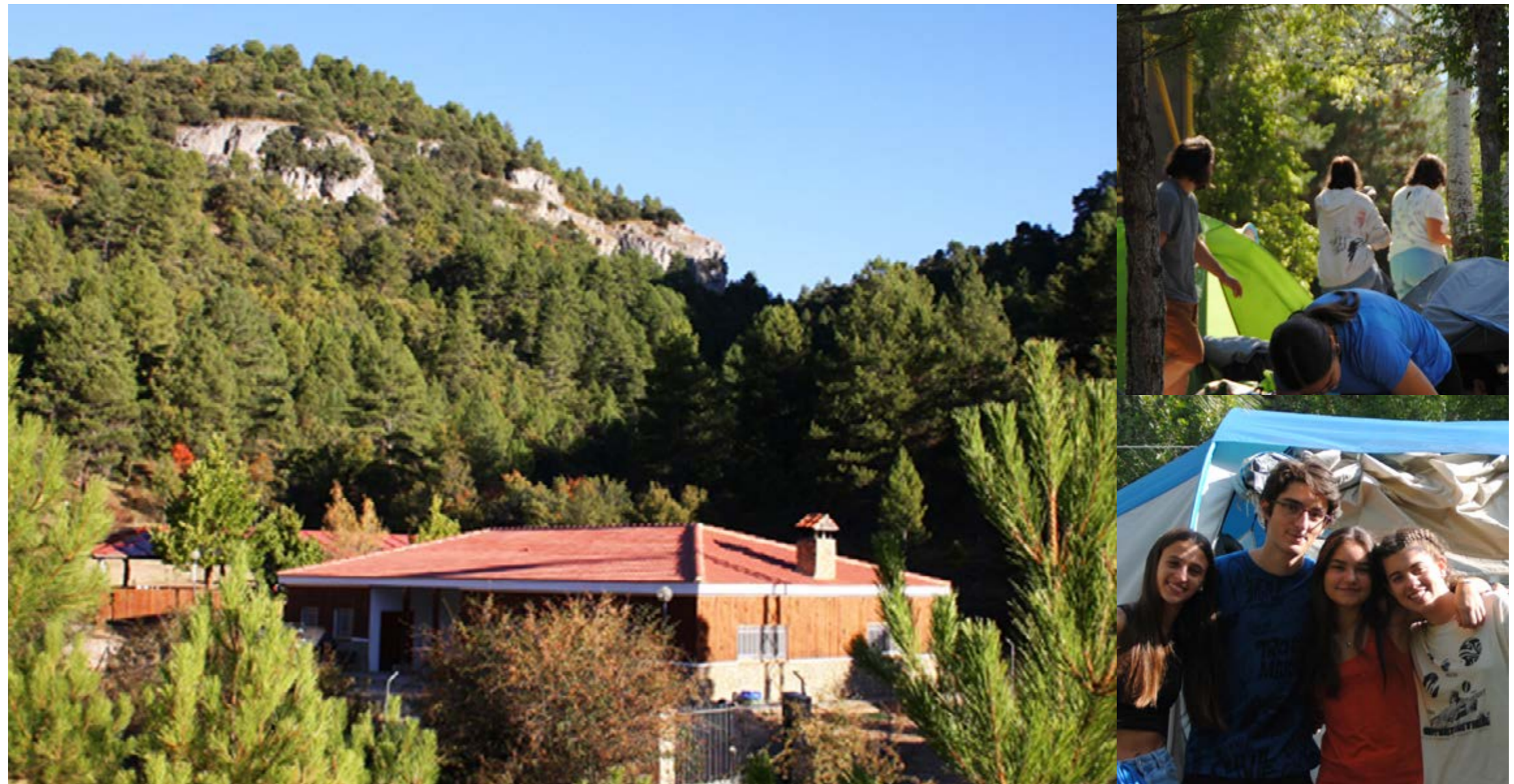
Vista panorámica del bosque en el que se encuentra el Campamento Alto Tajo