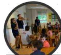
Orden y limpieza