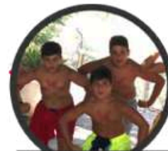
Trabajo en equipo