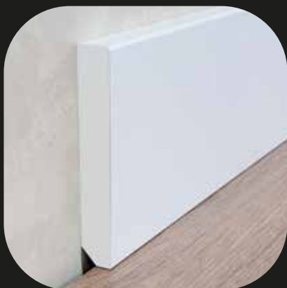
Rodapié blanco Base PVC espumado - lacado blanco