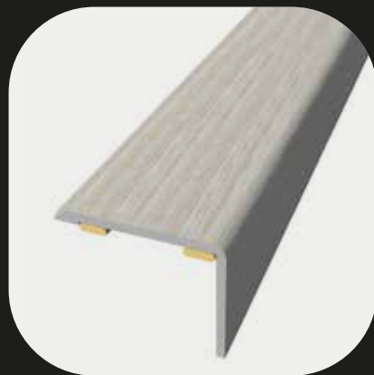
Cantonera Base de aluminio Adhesivo