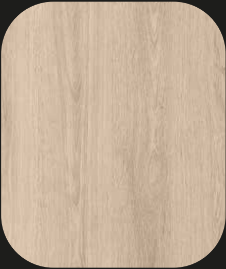
CES01 Roble Venecia