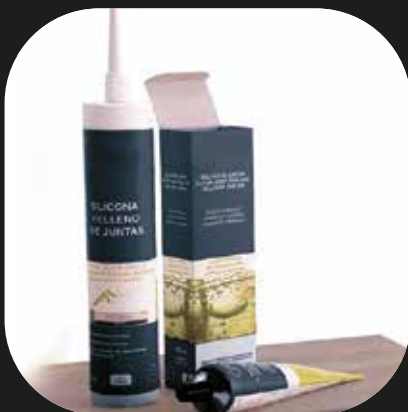
Sellador de juntas Silicona de relleno