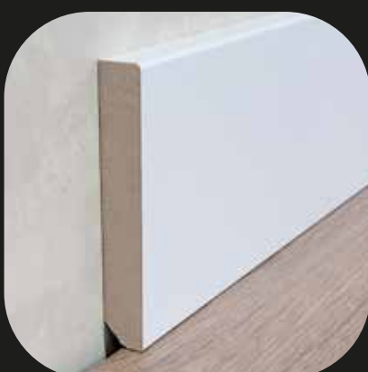
Rodapié blanco Base MDF - lacado blanco - laminado blanco