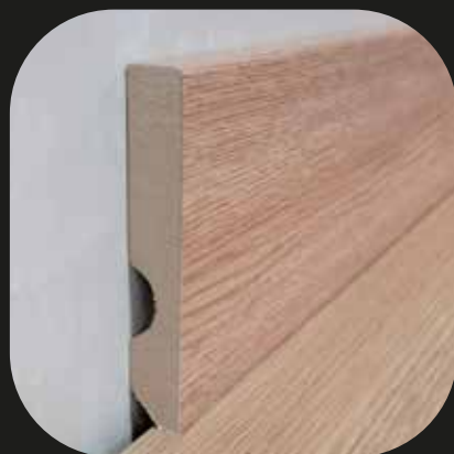
Rodapié laminado Base MDF - laminado