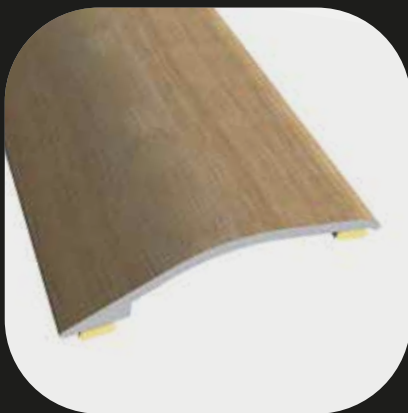
Perfil de transición Base de aluminio Adhesivo