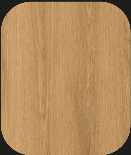
CES06 Roble Palermo