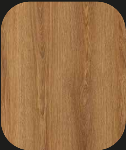
CES05 Roble Napoles