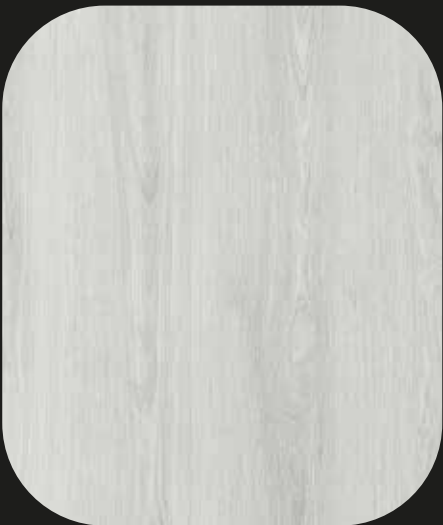
CES04 Roble Catania