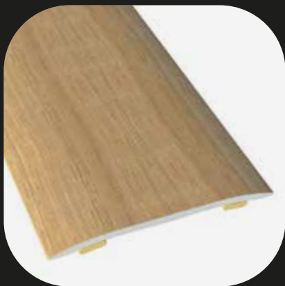
Perfil de expansión Base de aluminio Adhesivo

Accesorios disponibles para todas nuestras gamas de productos.