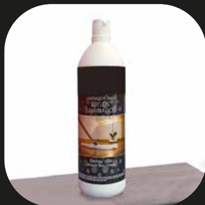
Limpiador para suelos laminados

La garantía está sujeta a la utilización de accesorios.