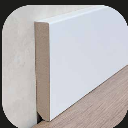
Rodapié blanco Base MDF - lacado blanco - laminado blanco