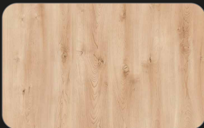
CPL07 Roble Calafat