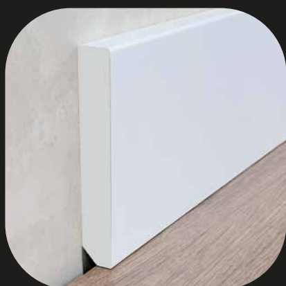
Rodapié blanco Base PVC espumado - lacado blanco