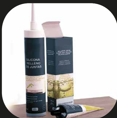
Sellador de juntas Silicona de relleno