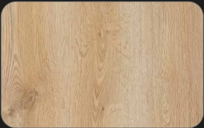
CPL08 Roble Estoril