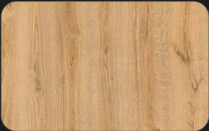
CPL06 Roble Jarama