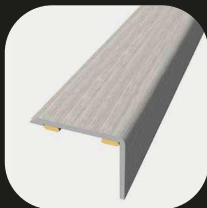
Cantonera Base de aluminio Adhesivo