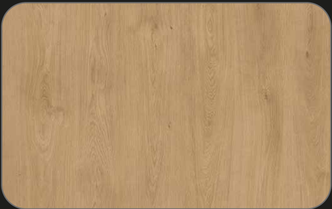
CPL02 Roble Losail