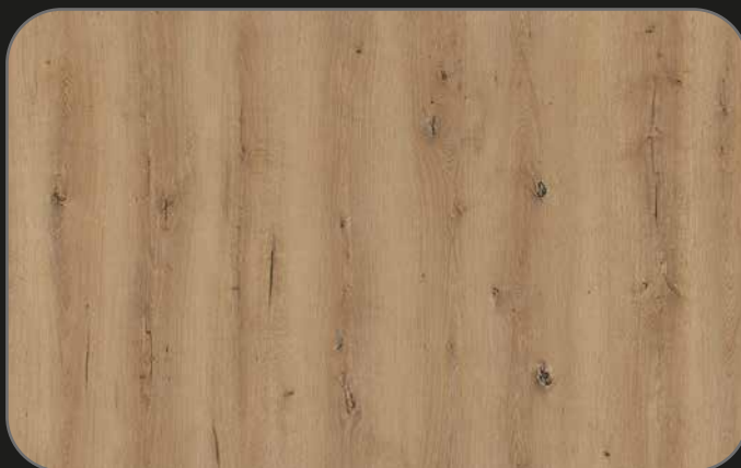
CPL01 Roble Monza

Tamaño pieza: 1.200 x 191 x 8 mm 1,83 m 2 /caja