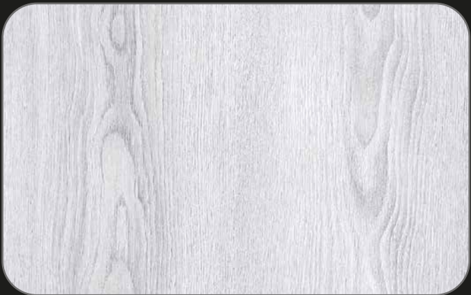
CPL05 Roble Assen