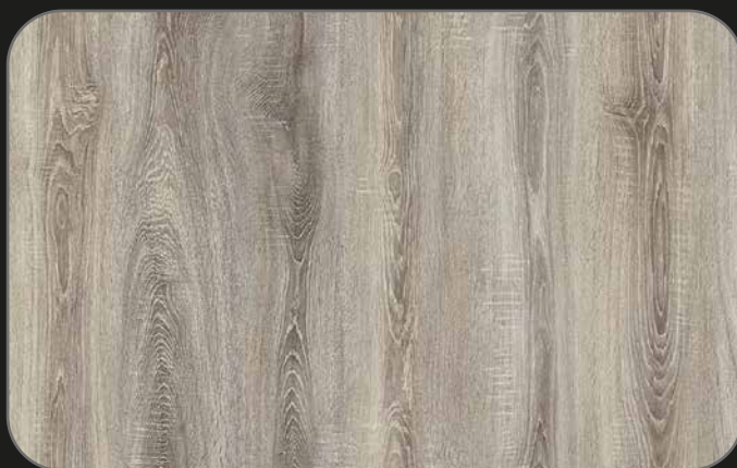
CPL04 Roble Misano