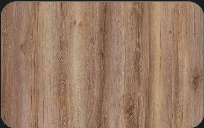
CPL03 Roble Jerez