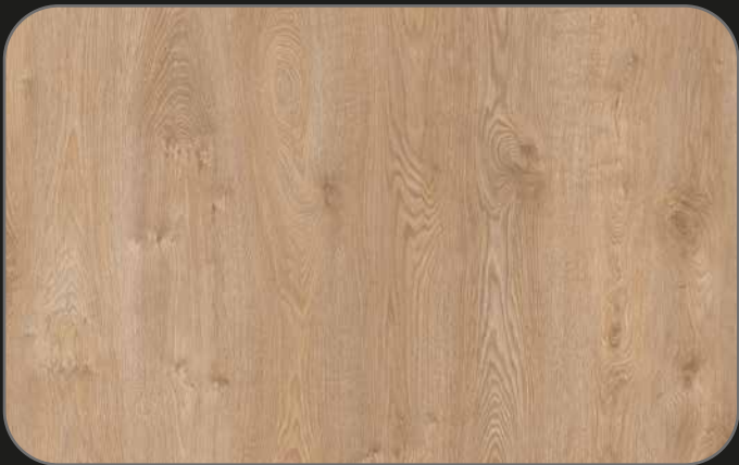
CPL09 Roble Cheste