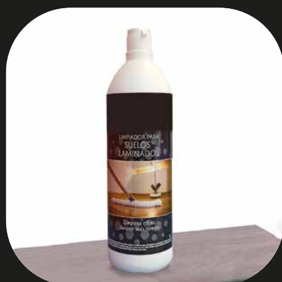
Limpiador para suelos laminados

La garantía está sujeta a la utilización de accesorios.