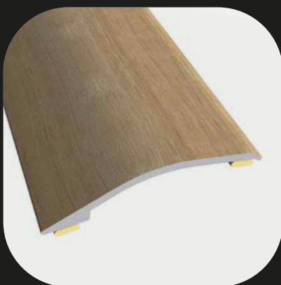
Perfil de transición Base de aluminio Adhesivo