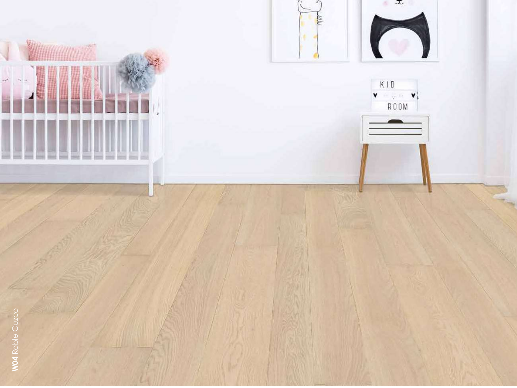
W04 Roble Cuzco