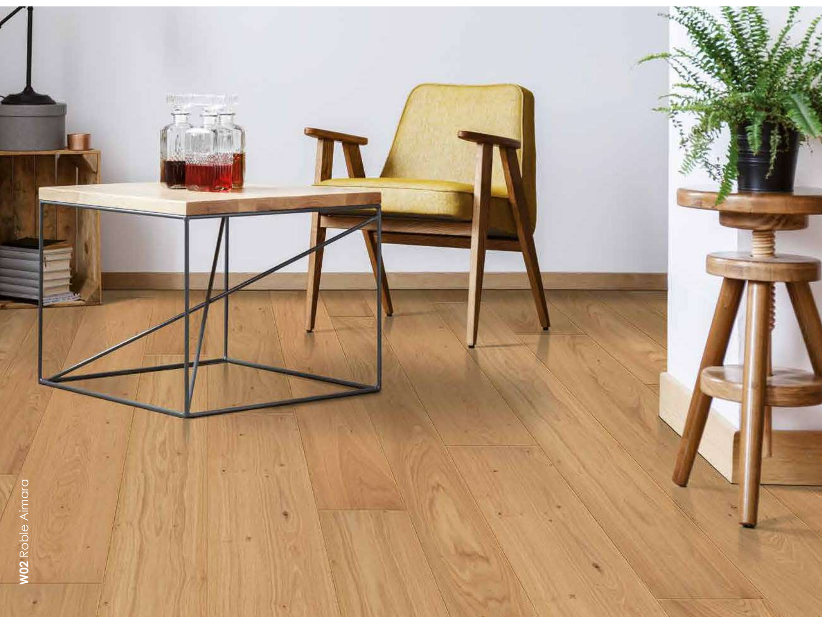
W02 Roble Aimara