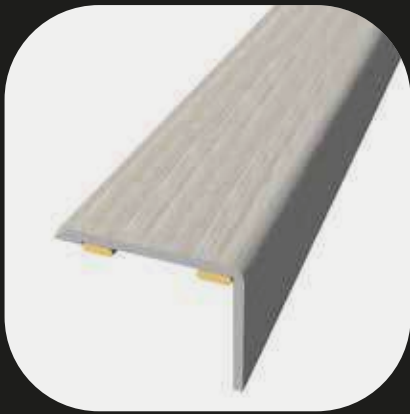
Cantonera Base de aluminio Adhesivo