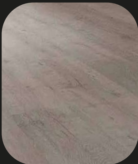
CE210 Roble Esla