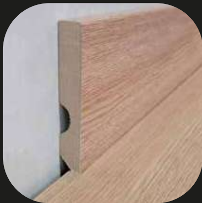
Rodapié laminado Base MDF - laminado