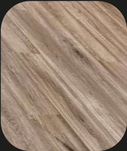
CE202 Roble Miño