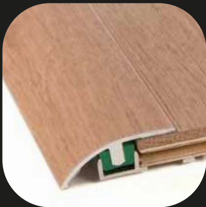
Perfil de transición + guía Base de aluminio