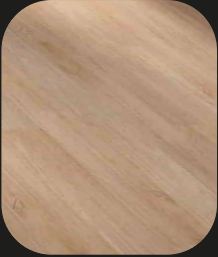
CE206 Roble Pisuerga