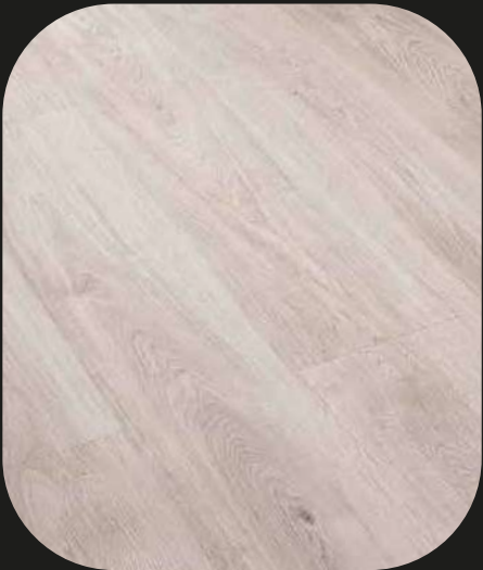
CE203 Roble Duero