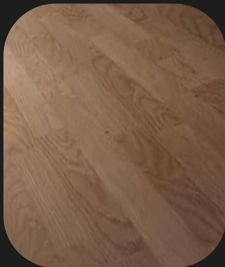
CE211 Roble Genil