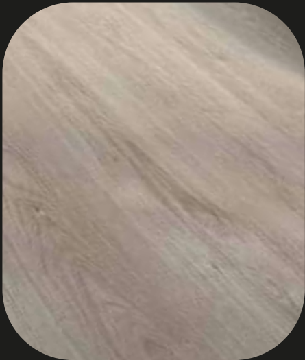
CE201 Roble Ebro

Tamaño pieza: 1.200 x 196 x 8 mm 2,12 m 2 /caja