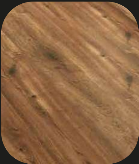
CE204 Roble Turia