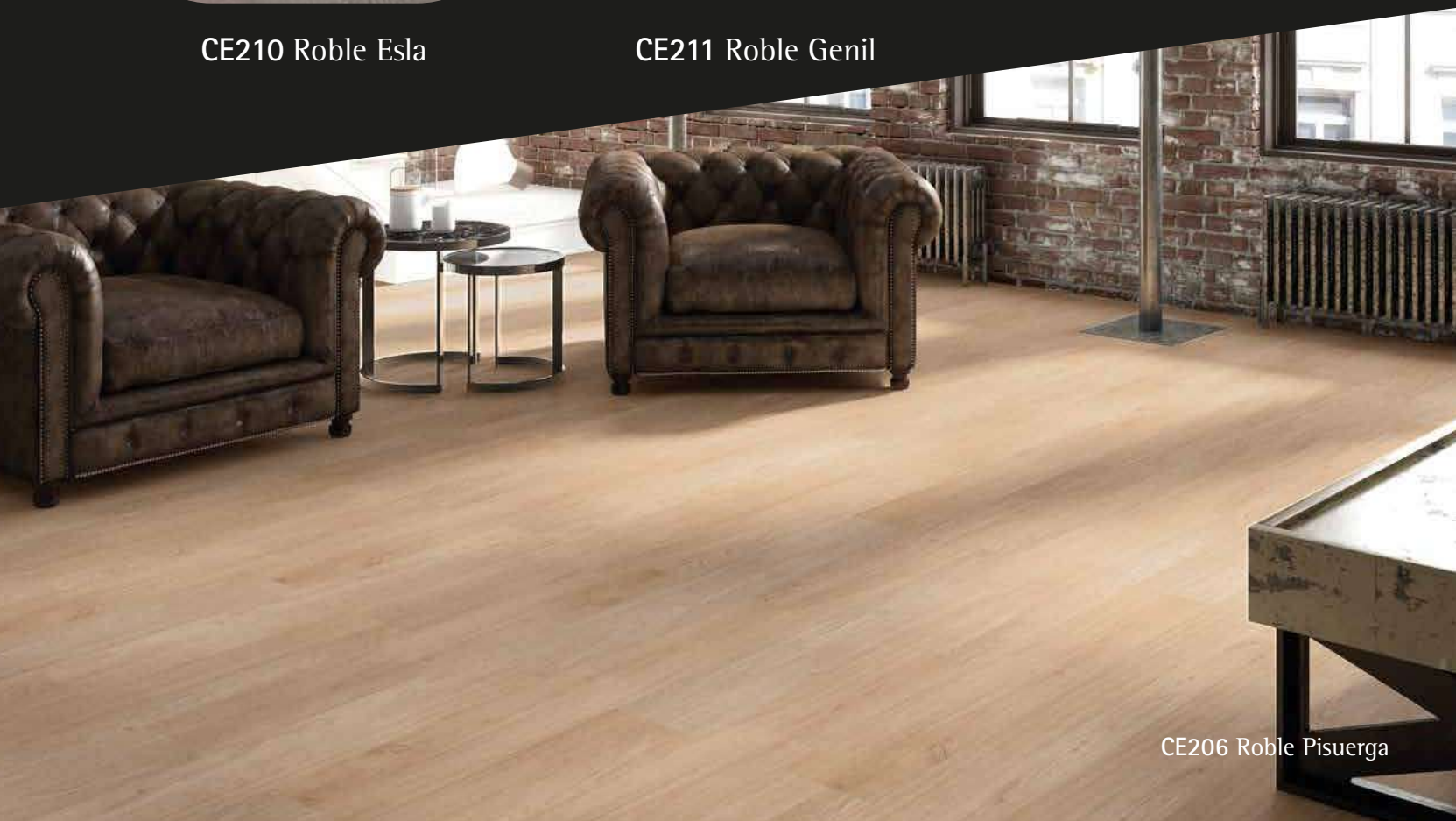
CE206 Roble Pisuerba