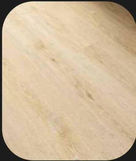
CE208 Roble Tormes