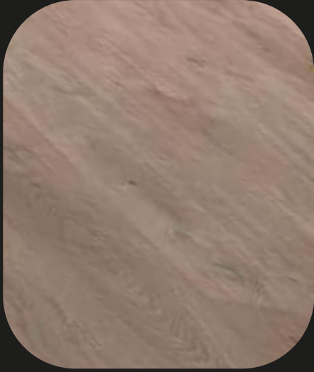
CE205 Roble Tajo