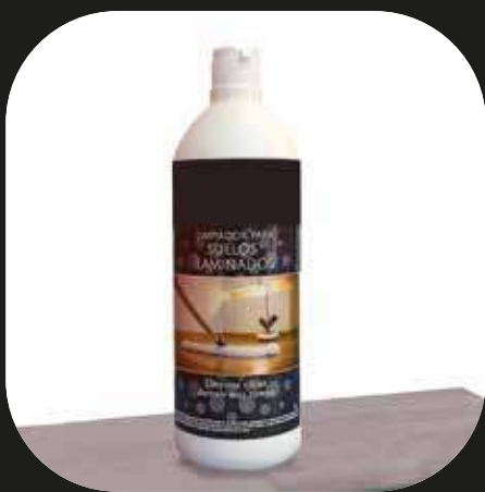
Limpiador para suelos laminados