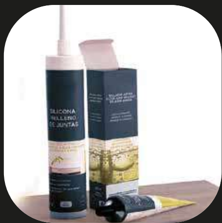
Sellador de juntas Silicona de relleno