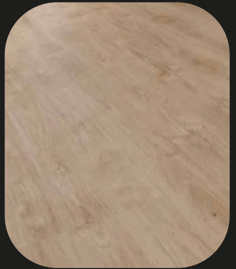
CE209 Roble Tambre