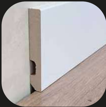
Rodapié blanco Base MDF - lacado blanco - laminado blanco