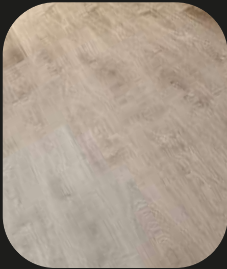
CE207 Roble Cinca